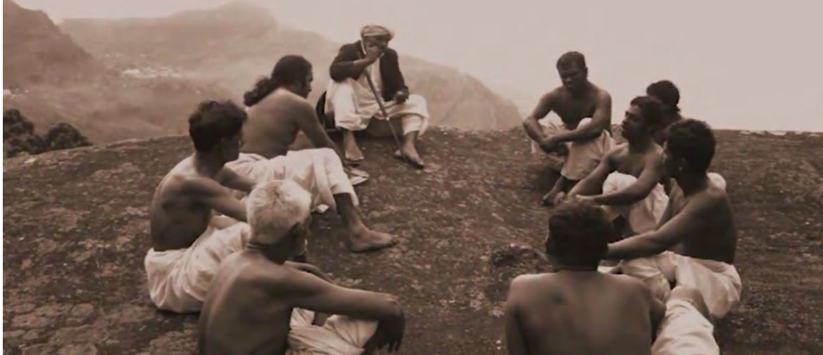
Echoing Hills (2018)