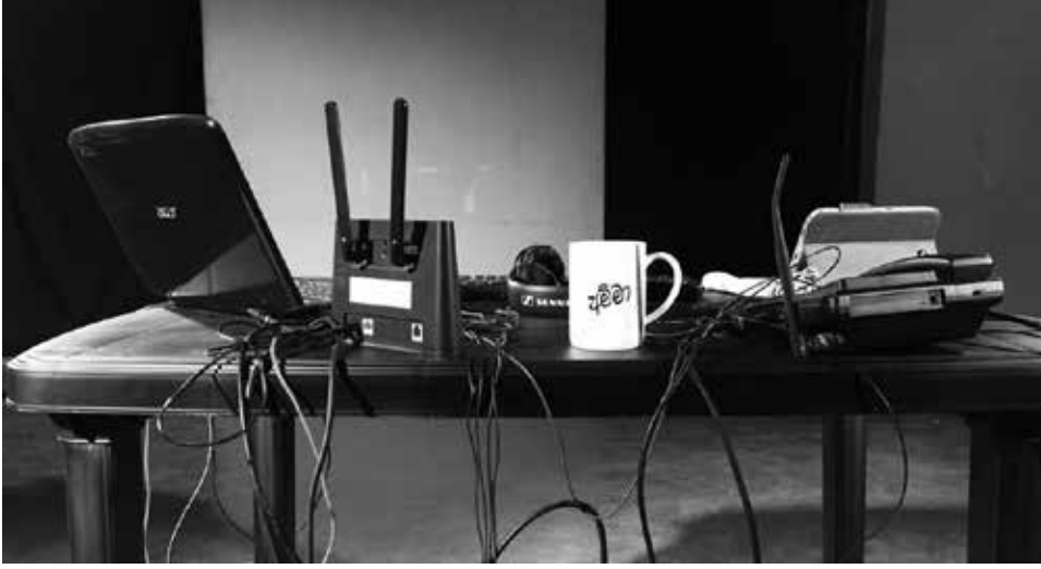
கணினியுடன் மேடை பின்புல புகைப்படம், நாடக உருவாக்க புகைப்பட தொகுப்பிலிருந்து Stages Theatre Group.