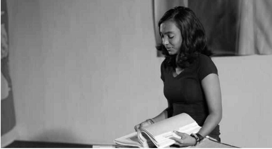
The Certificate at the UNHCR Prada Buwaneka