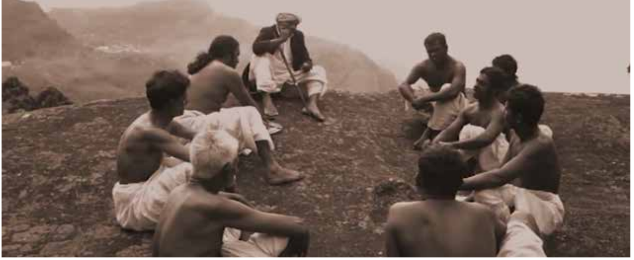
Echoing Hills (2018) Documentary Film