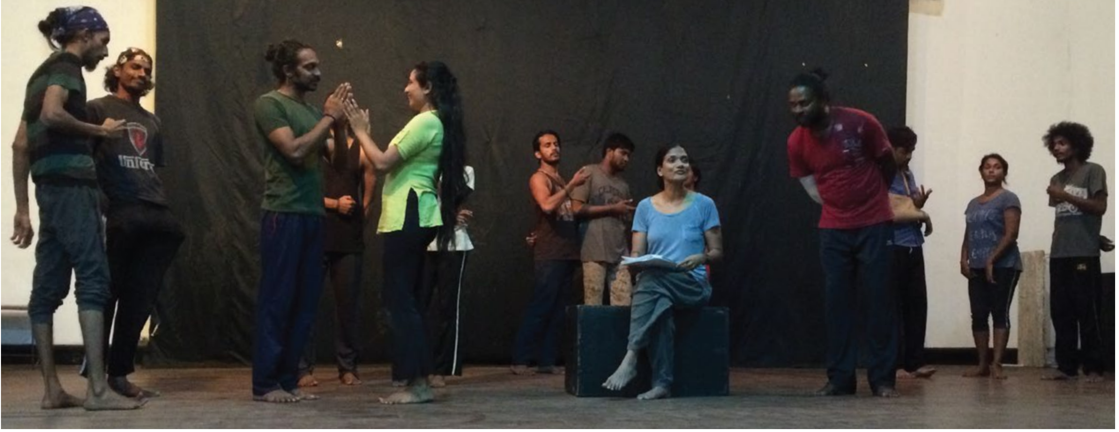
Devised western greetings incorporated into the scene