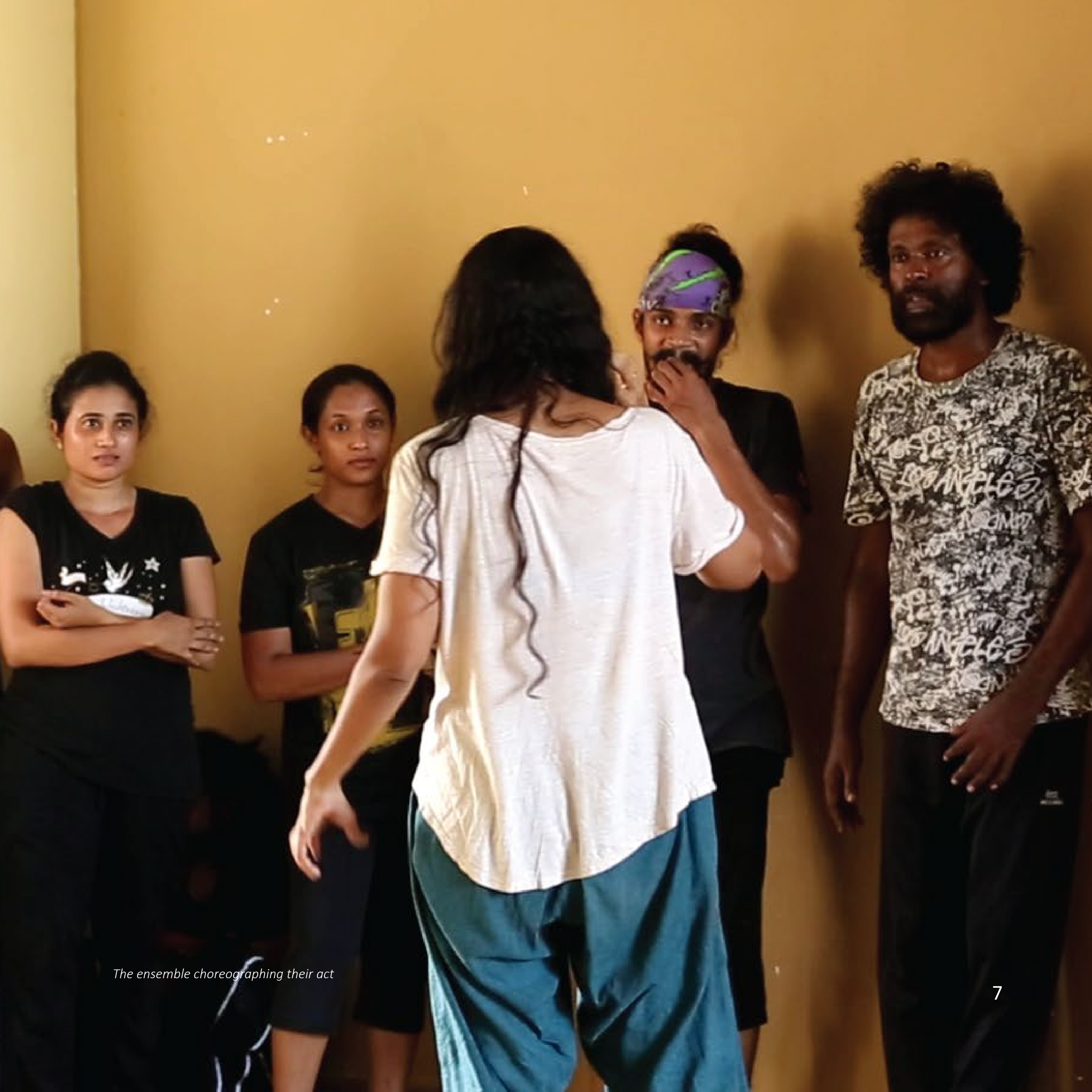
The ensemble choreographing their act