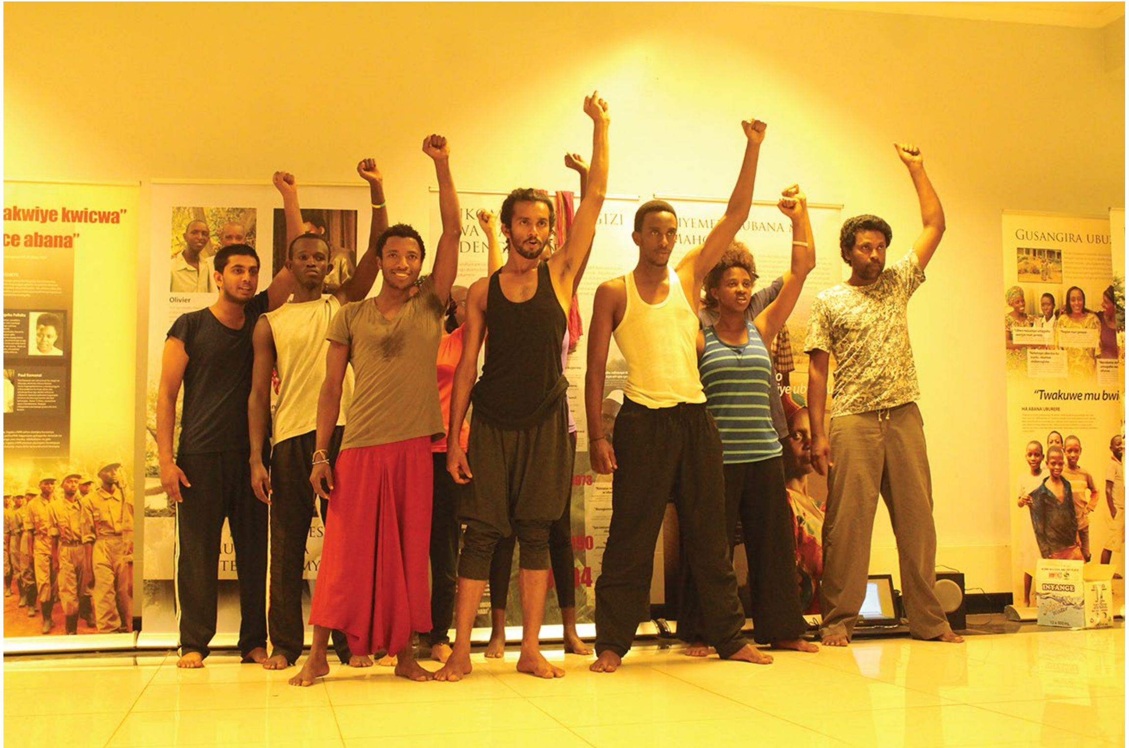
This scene was first devised in Rwanda with Sri Lanka – Rwanda actors

இந்த காட்சியின் தோற்றம் ருவாண்டா மற்றும் இலங்கையின் இரண்டு நடன மரபுகளை அடிப்படையாகக் கொண்டது.