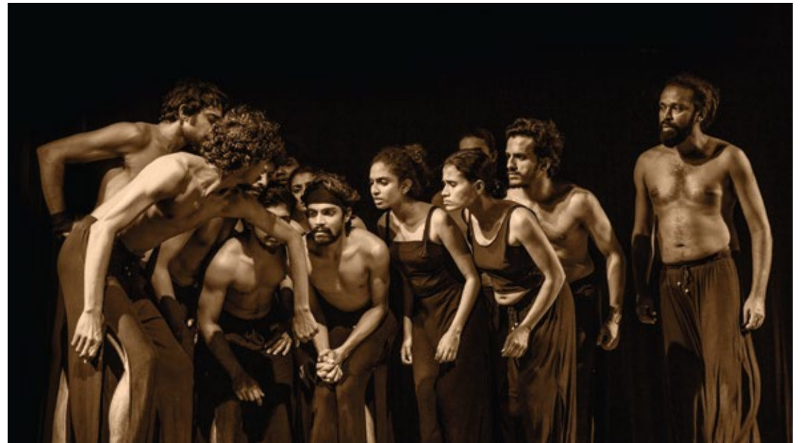
The theatrical exercise is used in performance, as well as at the beginning of the scene to intensify the emotion and tension of the 1983 Black July.