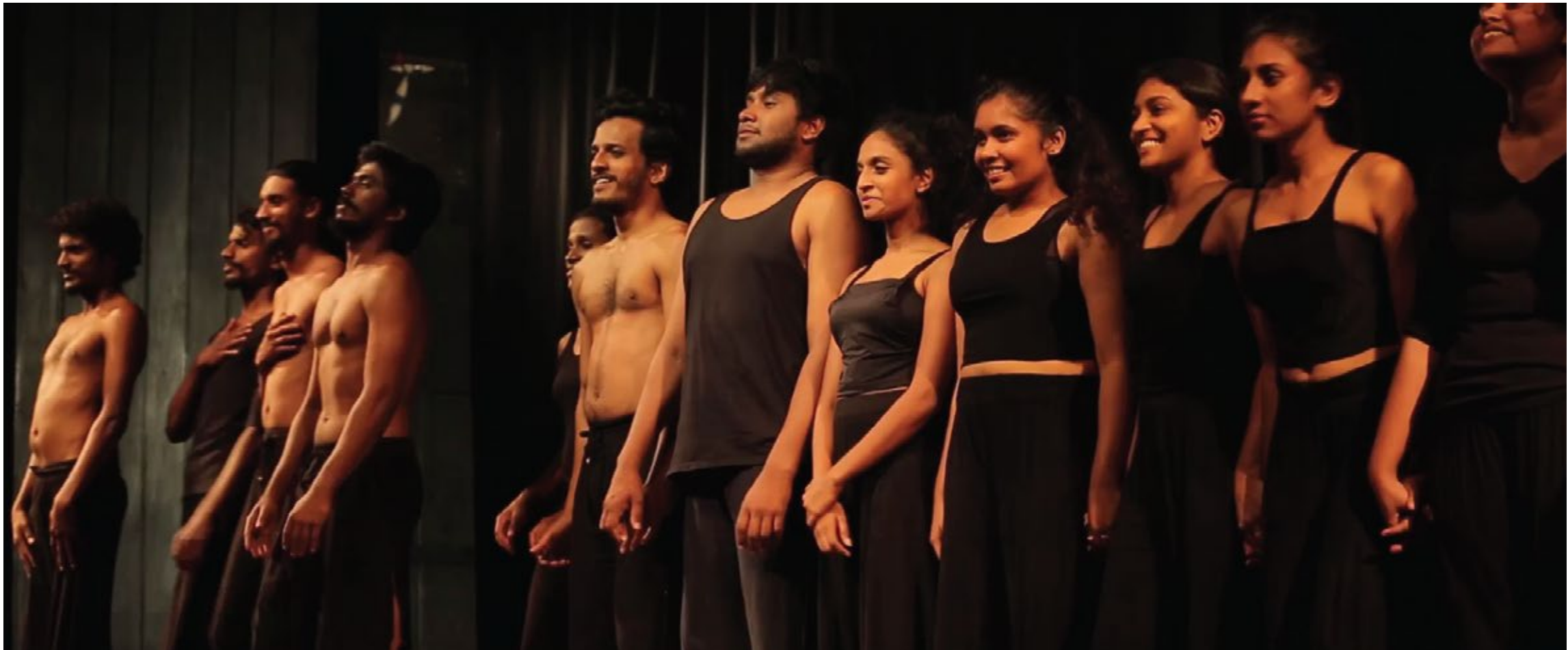
Relaxing after keeping peek energy in their bodies for 90 minutes