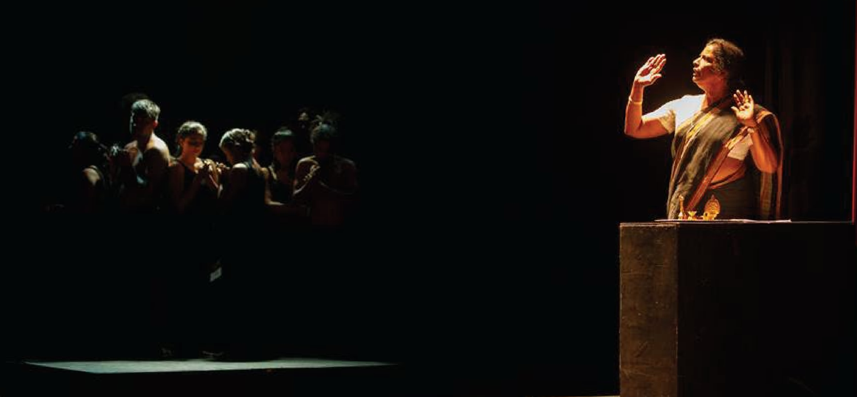
Scene: Sri Lanka in the 2000s - The story of Menik Farm (2019)