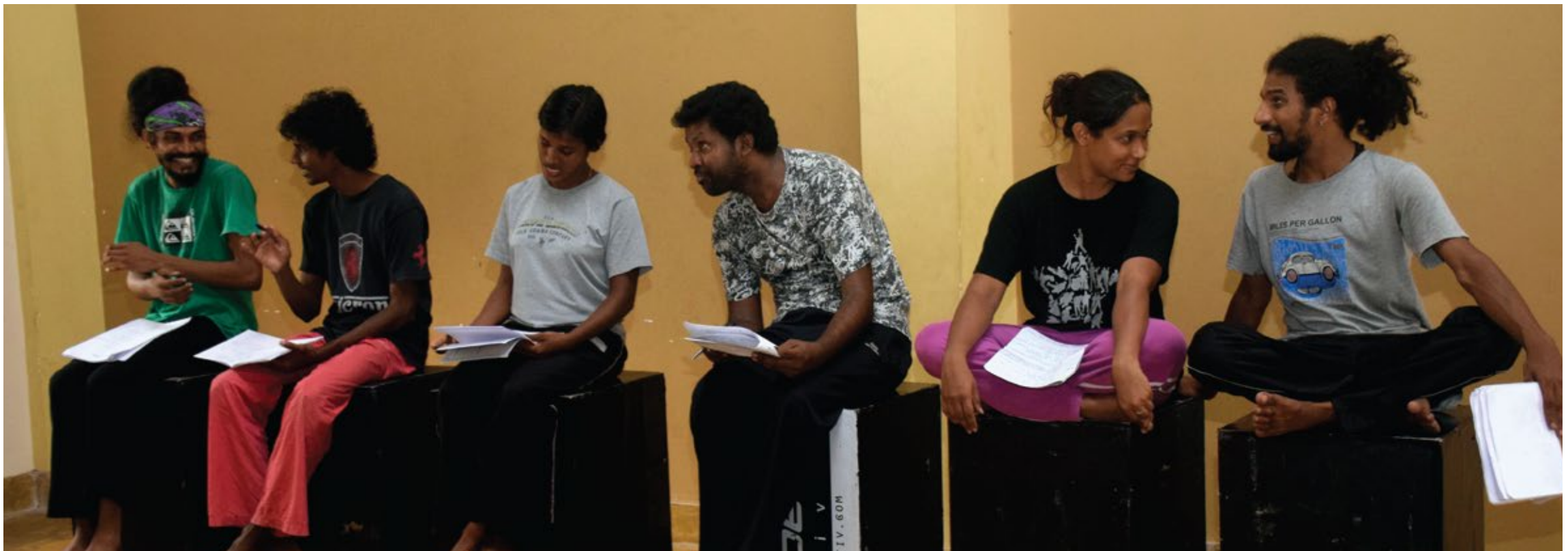
The ensemble devising how to present data and information as journalists

'இலங்கை உள்நாட்டுப் போரின்' நேரடி இயங்கும் வர்ணனையின் உருவகம் மிக விரைவில் இடம் பெற்றது..