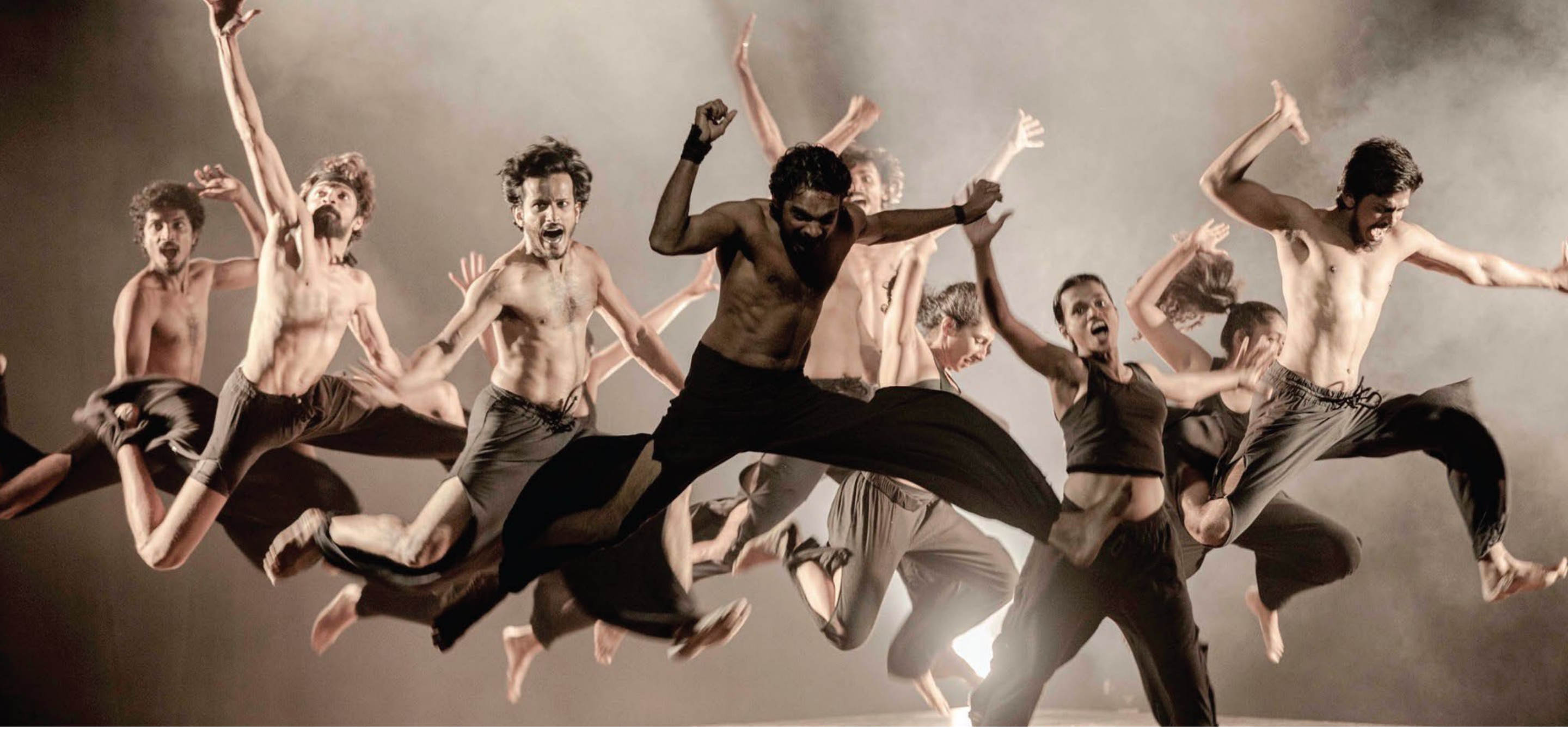
Scene: Sri Lanka in the 70s - The story of Youth Insurrection (2019)