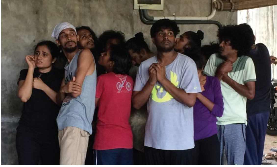
The ensemble choreographing their act