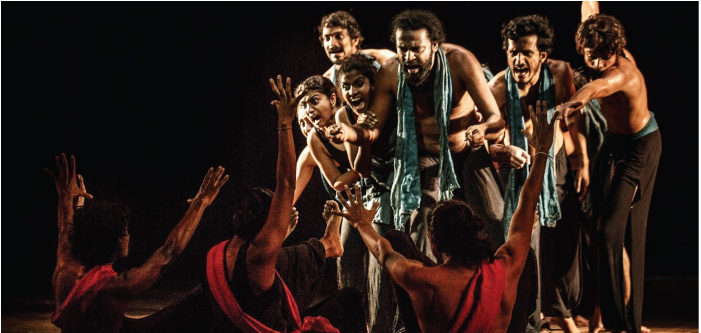
Although black is used in the overall design of the play, red and green are used symbolically