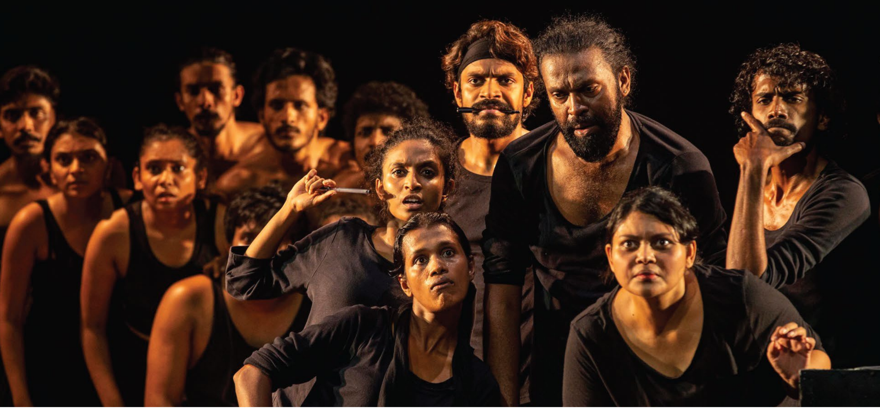
Scene: Sri Lanka in the 90s - The story of the Big Match (2019)