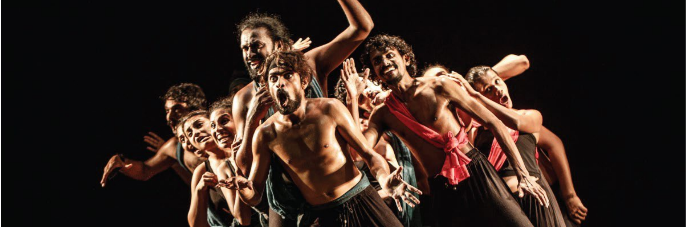
The ensemble identify each other's rhythm and maintain the visual aesthetic of the scene through synchronized movement

இது நள்ளிரவு கடந்துவிட்டது, ஆனால் நடிகர்கள் ஒப்புக் கொண்டனர், திடீரென்று ... காட்சி உண்மையான அதிர்வு மற்றும் சக்தியின் இடத்திற்கு உயர்த்தப்பட்டது. நிகழ்ச்சி துவங்குவதற்கு சில மணி நேரங்களுக்கு முன்பு, அந்த காட்சி இடம் பெற்றது.