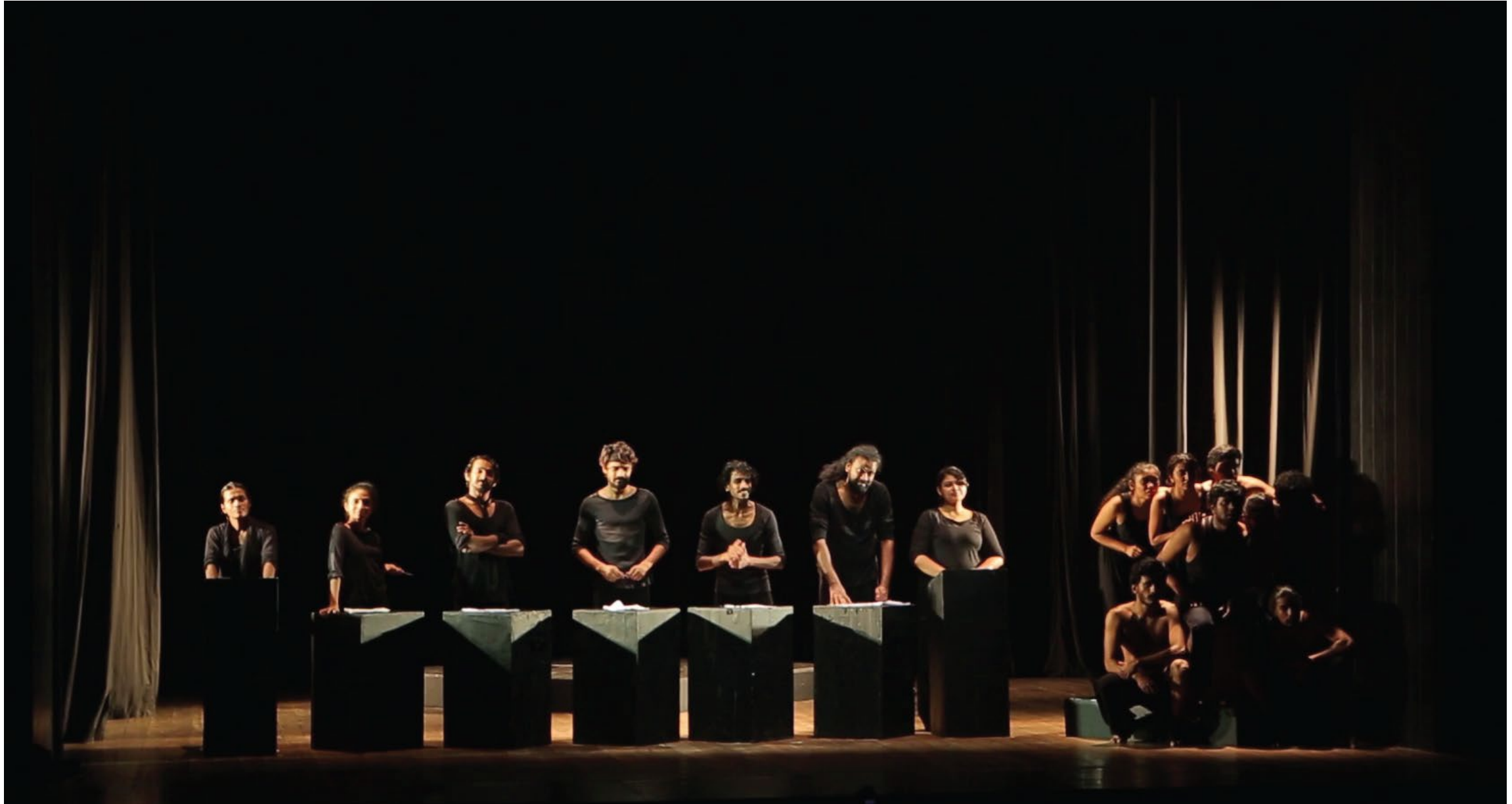
How the characters of the journalists and the general public are positioned on the stage

வெளிப்படையாக, செயல்திறன் பாணி முன்வைக்கப்படும் வி'யத்துடன் கடுமையாக மாறுபடுகிறது - ஒரு போரின் போது மரணம் மற்றும் அழிவின் கடுமையான உண்மைகள். இந்த மோதலின் விளைவாக காட்சி ஒரு இருண்ட நகைச்சுவை பாணியில் வருகிறது..