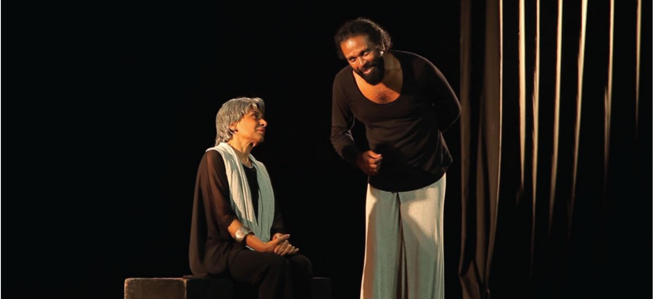
Scene: Sri Lanka in the 60s - The story of Ceylon Coup (2019)

டி.சி.எஸ் - ஏழு தசாப்தங்களில், இந்த எளிய கதை சொல்லும் நுட்பம் பின்னணியில் குழுமத்தைச் சேர்த்து இரண்டு சந்தர்ப்பங்களில் விரிவுபடுத்தப்படுகிறது - மேடையில் விவரிக்கப்படும் இரண்டு சம்பவங்களைச் செயல்படுத்தும். இந்த இரண்டு தலையீடுகளிலும் குழுமத்தின் செயல்திறனின் பாணி லேடி மற்றும் விஜேசோமாவால் பராமரிக்கப்படும் இயற்கையான கதை சொல்லும் செயல்திறன்-பாணியுடன் ஒப்பிடுகையில் பகட்டானது மற்றும் மிகைப்படுத்தப்பட்டுள்ளது..