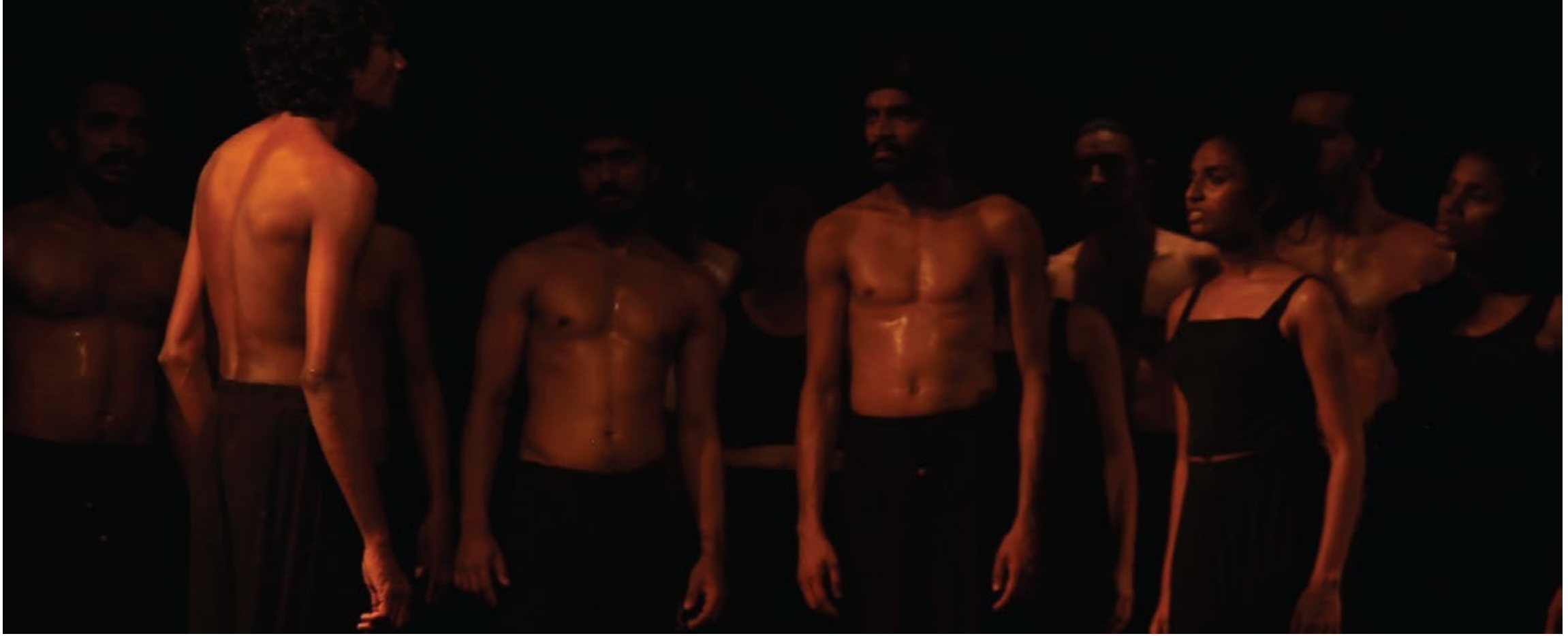
segment 01 - 'demellu' - Tamils