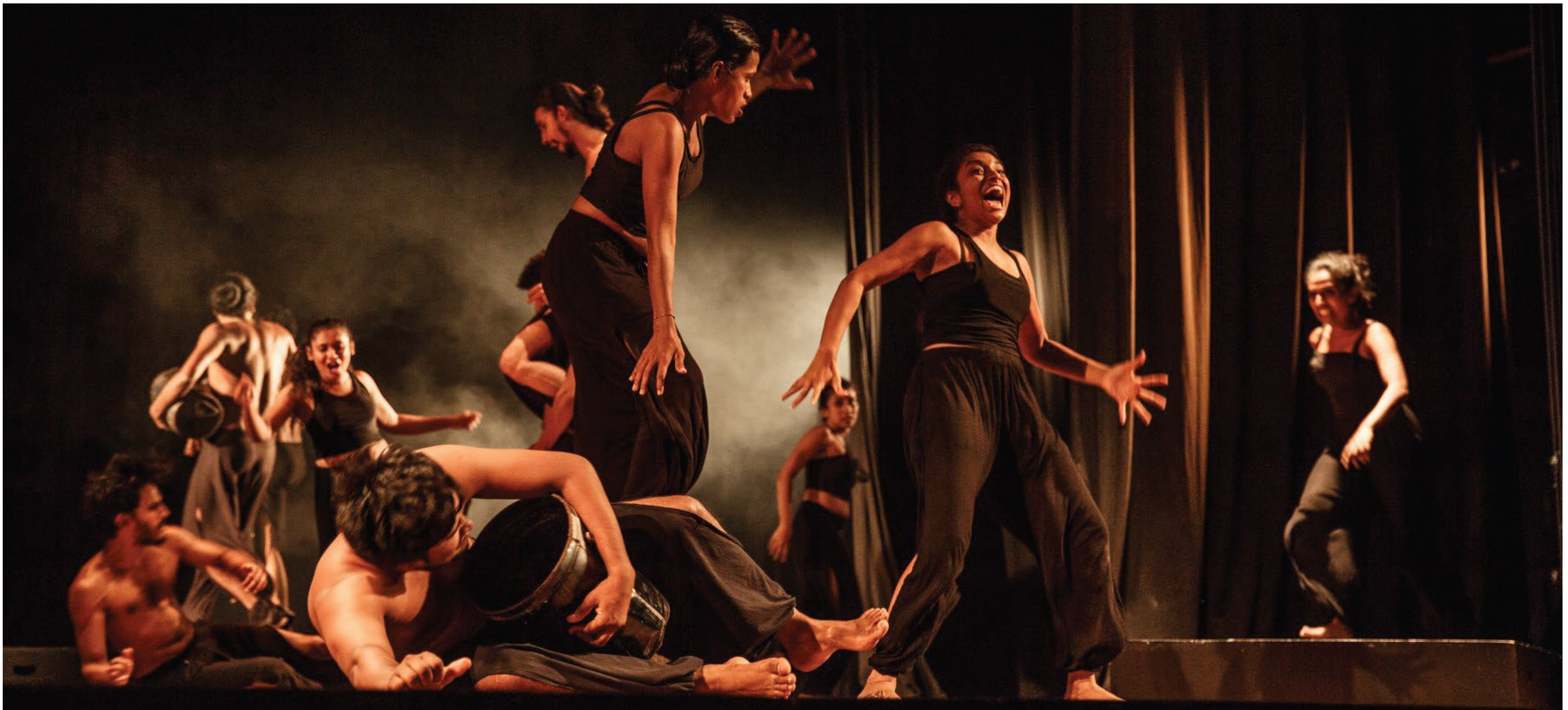
segment 02 - 'lutex' - Lutex