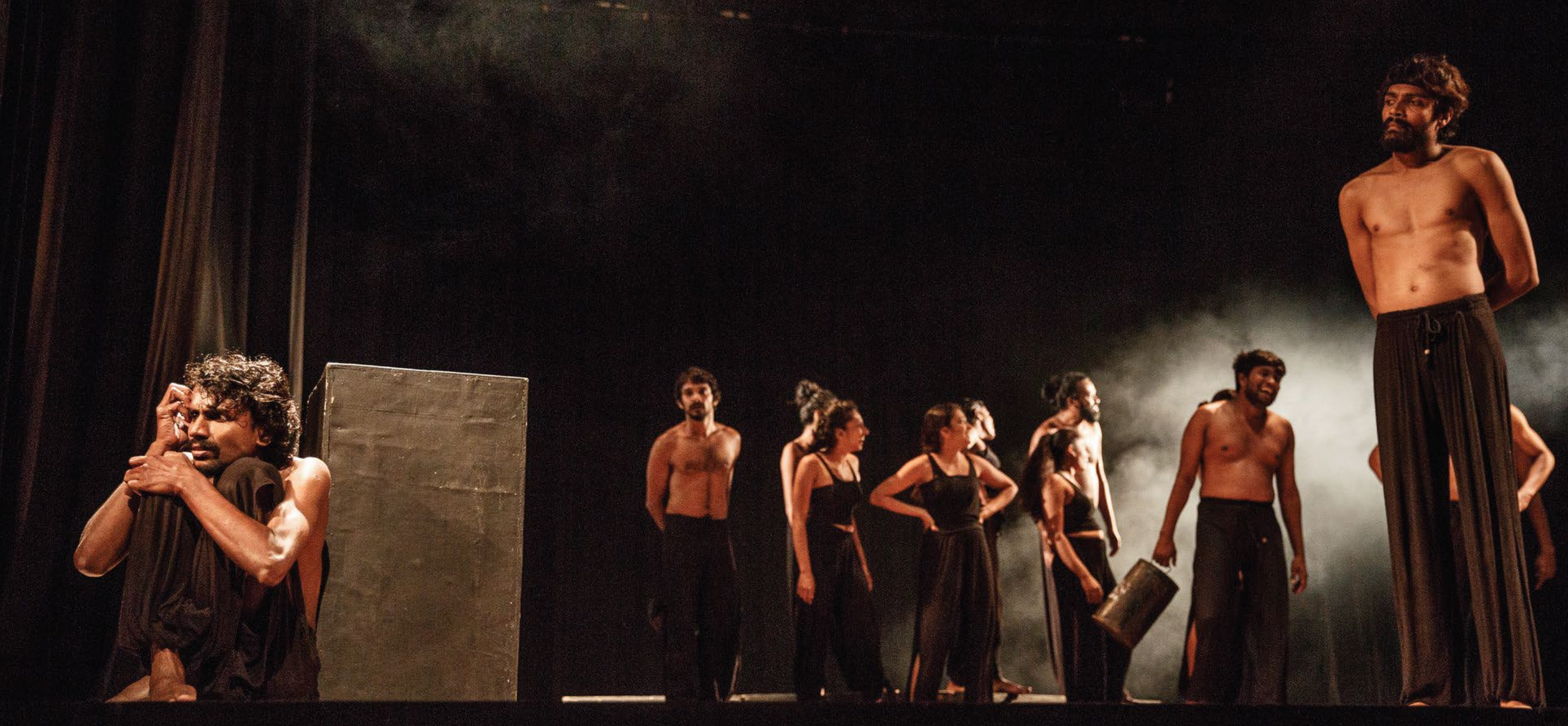
[Scene: Sri Lanka in the 80s - The story of Black July (2019)]