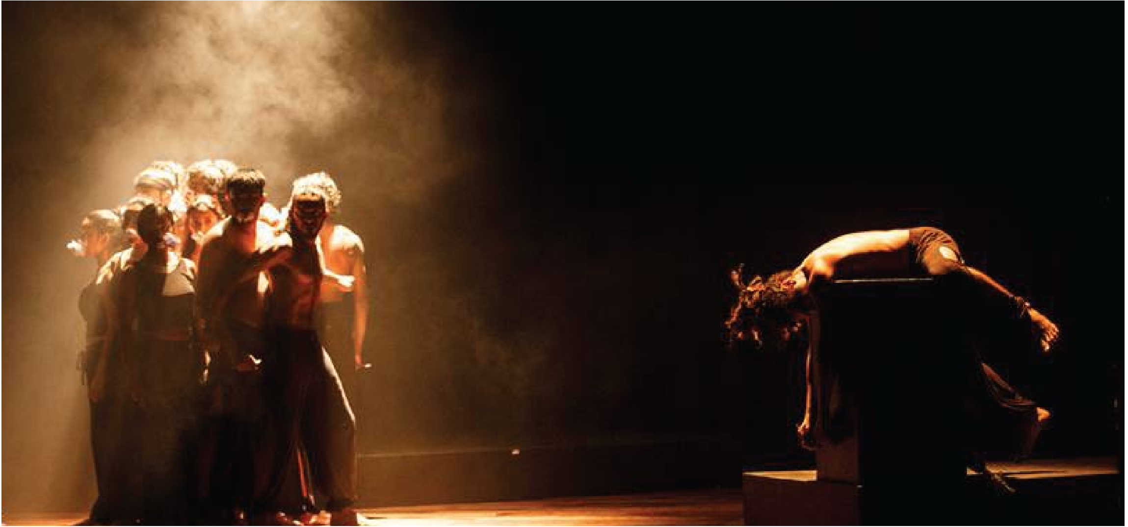
The mistake in training developed as the final moment of the 1971 insurrection scene